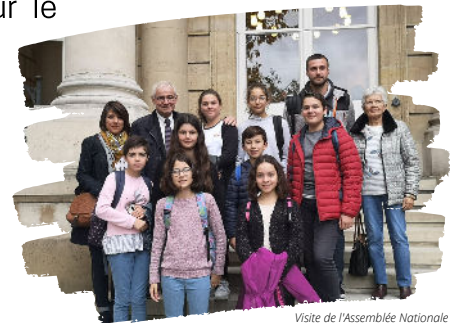
Visite de l'Assemblée Nationale

Avant de repartir, nous avons fait un tour en bus dans Paris et vu la Tour Eiffel.