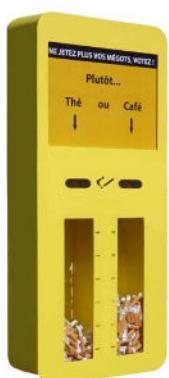
Cendrier sondage (photo non exhaustive)

Cendriers sondage, simple... choisir entre 2 propositions !